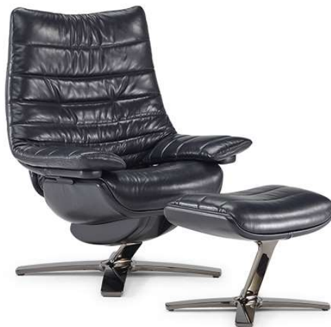
■ Vers. 704