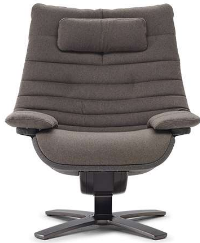
■ Vers. 713