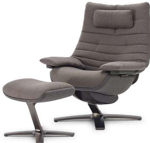
■ Vers. 700