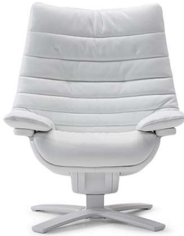
■ Vers. 703