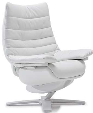
■ Vers. 703