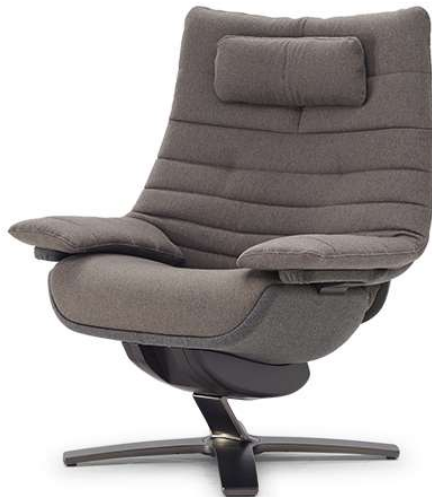
■ Vers. 713